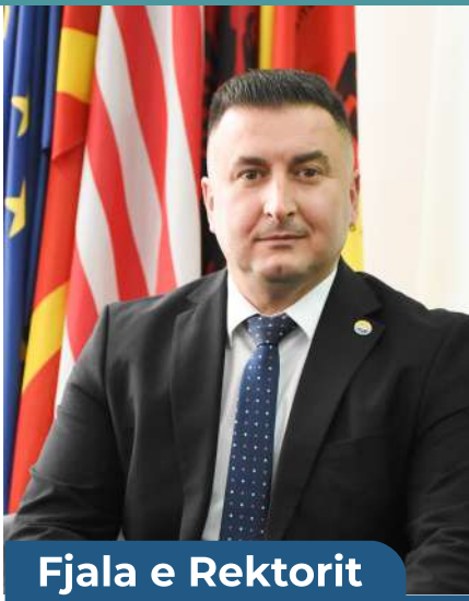
Fjala e Rektorit

Studentëve u mundëson të përfitojnë dije të thelluara nga fushat e ndryshme shkencore, të zhvillojnë aftësitë akademike, intelektuale e profesionale si dhe në të ardhmen të inkuadrohen në tregun e punës.